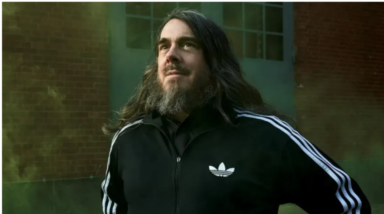
Performance bis Malerei: Der Künstler Jonathan Meese ist in verschiedenen Gattungen zu Hause.