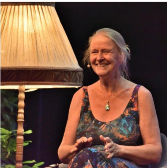
Cornelia Funke kam zur Eröffnungsveranstaltung von FeeLit extra aus der Toskana, wo sie in der Nähe von Volterra in einer ehemaligen Alabasterfabrik lebt, nach Heidelberg gereist.