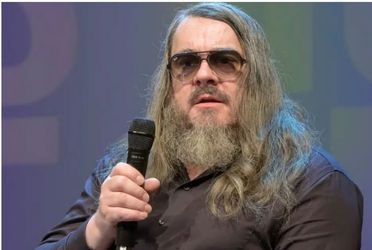
Ein bisschen gaga schadet nie: Rauschebart und „Riesenbaby“ Jonathan Meese.