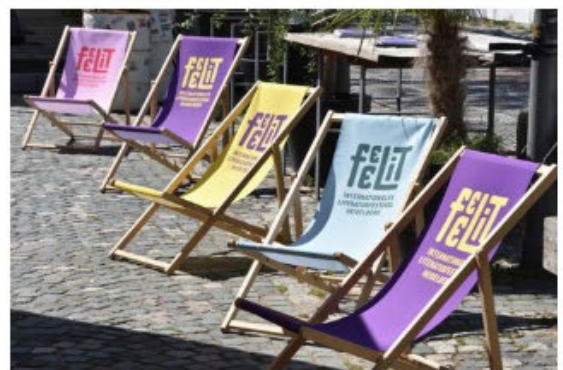
Direkt vor der Halle 02 gibt es Gelegenheit zum Relaxen und zum Reflektieren des Gehörten.