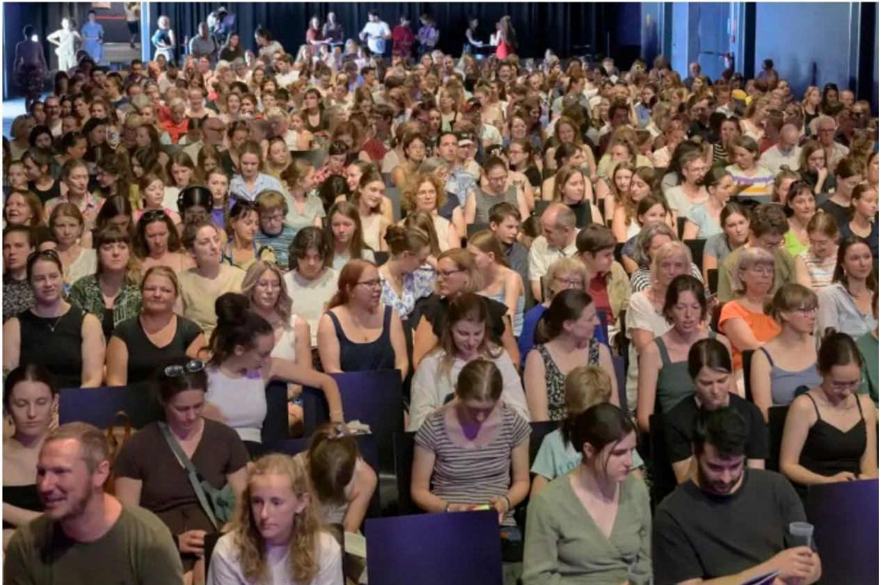
Nach der feeLit-Eröffnung in der halle02 (groß) buhlen mehr als 30 Veranstaltungen um die Aufmerksamkeit der hiesigen Buchfans.