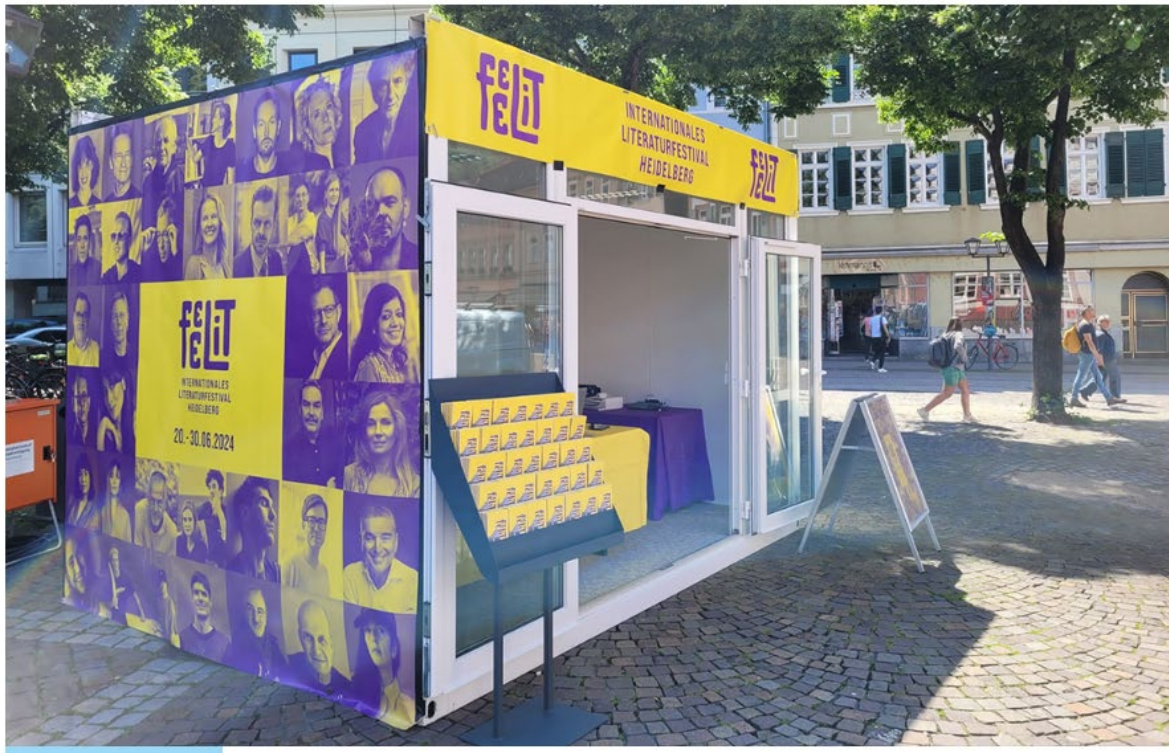
FEELIT - LITERATURFESTIVAL HEIDELBERG